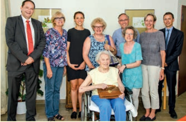
Die Projekte des Freundeskreis sind vielfältig: Unterstützt werden beispielsweise ...