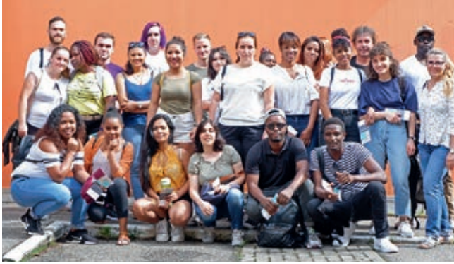
Die Auszubildenden und »FSJler« freuten sich auf einen spannenden Tag.