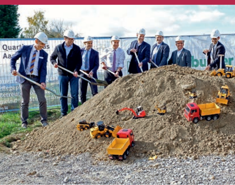
Der Spatenstich des Quartiershaus Aach.