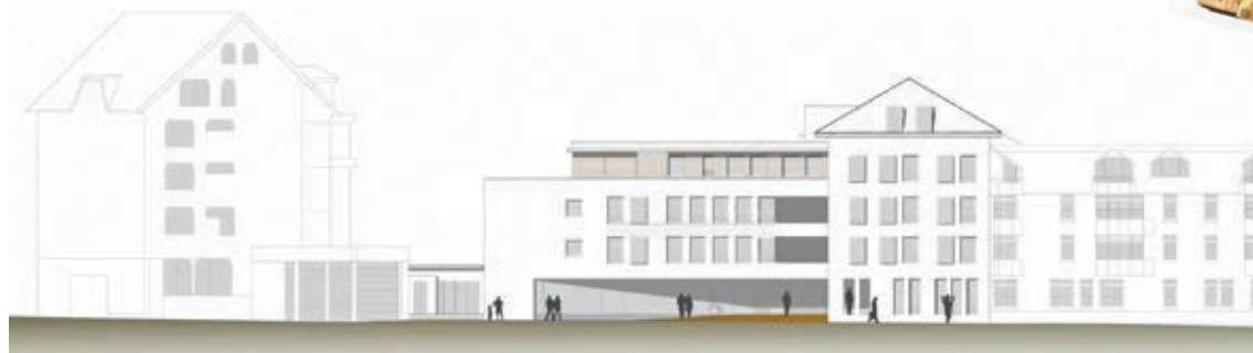
Der geplante Erweiterungsbau des Haus Schloßberg.

Nach Erhalt der Baufreigabe werden die Gebäude der Hermannstraße 12 und 12 a planmäßig ab ca. Februar 2020 abgerissen werden. Der geplante Einzugstermin ist für das erste Halbjahr 2022 anberaumt.