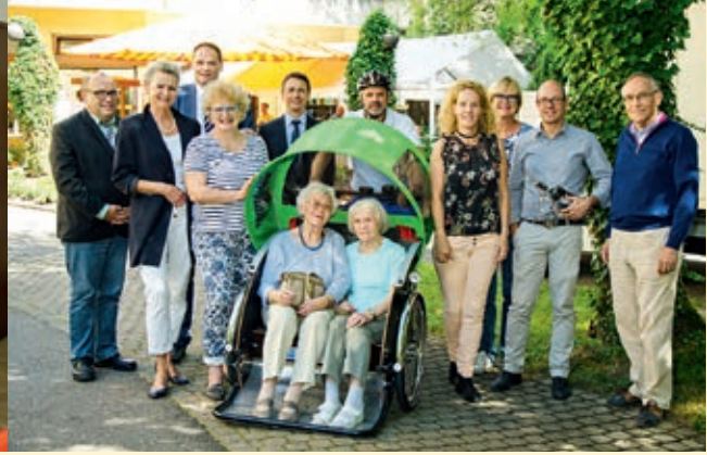
... die Kunsttherapiegruppe im Carl-Mez-Haus und die Rikschafahrten im Haus Schloßberg